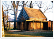
Slawischer Burgwall Kaiserliches Remontedepot Moderne Großgemeinde